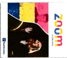
Zoom: Volante de los eventos actuales* Las novedades y las noticias de deportes y entretenimientos más memorables del año

The year's most memorable news, sports and entertainment news.