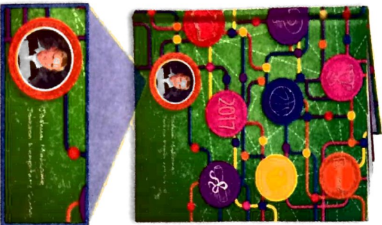
Tapa personalizada El retrato y el nombre de tu hijo impresos en la tapa.

Your child's portrait and name printed on the cover.