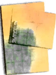
Inserción del autógrafo* Una excelente manera de compartir mensajes con los amigos!

A great way to share messages with friends!